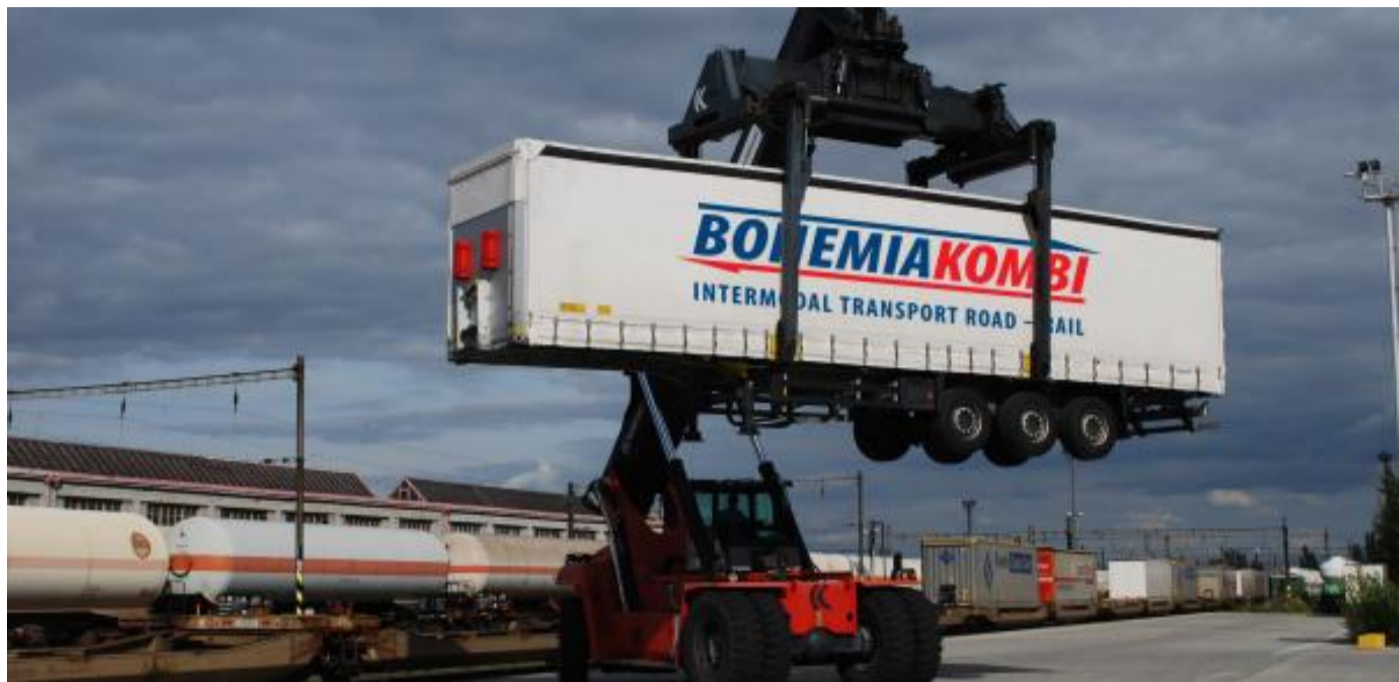
KOMBINOVNÁ DOPRAVA. Ilustrační snímek nakládky automobilového přívěsu určeného pro železniční přepravu.

Od roku 1996 je Bohemiakombi členem UIRR – evropského sdružení operátorů kombinované dopravy. Sdru-